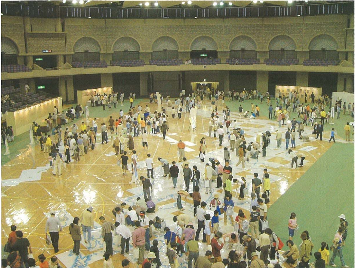
伊能忠敬大図展（鹿児島アリーナにて）